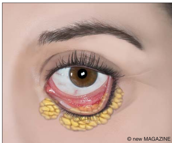
Figura 12. Blefaroplastica inferiore mediante accesso transcongiuntivale.

piccola striscia di muscolo orbicolare e la riduzione delle borse adipose. Dopo un'attenta emostasi si procede alla sutura con punti sottili e alla medicazione. L'intervento alla palpebra inferiore può essere condotto per via esterna o attraverso un'incisione transcongiuntivale. Nel primo caso (blefaroplastica per via esterna) è condotto attraverso un'incisione che decorre pochi millimetri sotto la linea delle ciglia e si prolunga di poco lateralmente all'angolo esterno dell'occhio. Le borse adipose, secondo le tecniche, possono essere ridotte (asportate) o riposizionate per correggere eventuali difetti a livello del solco lacrimale (occhiaie). Si procede quindi alla rimozione della cute, se in eccesso, all'emostasi e alla sutura. Nel secondo caso (blefaroplastica transcongiuntivale), l'incisione è eseguita solo attraverso la congiuntiva (faccia interna della palpebra inferiore). L'eventuale eccesso cutaneo è corretto con incisione cutanea subciliare o con tecniche alternative (laser assistite o peeling chimici).