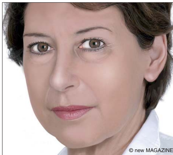
Figura 9. Blefaroplastica: aspetto pre-operatorio.

Il giorno dell’intervento è opportuno non eseguire il make-up del viso e dell’area perioculare e rimuovere